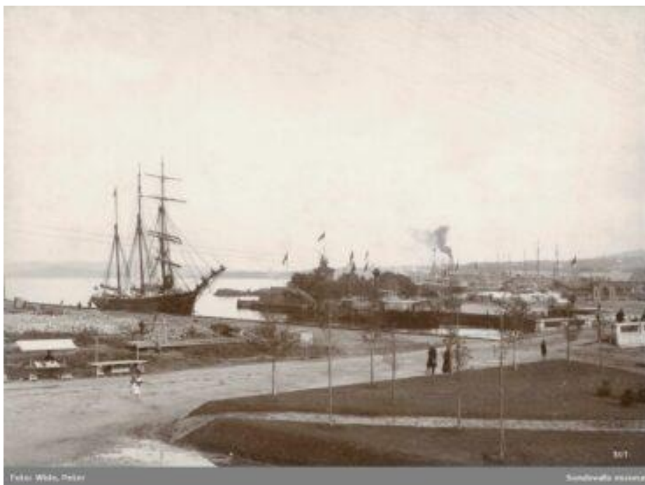
Foto från 1902. Inloppet till Selångerån med Tivolibron till höger. Bron byggdes 1890 som svängbro (dess mittparti finns fortfarande kvar) vilket gjorde att ganska stora fartyg kunde ta sig fram mot Puckelbron. Tornet mitt i bild tillhör kallbadhuset vid finnkajen. I bakgrunden ses Rosenborgs hammagasin