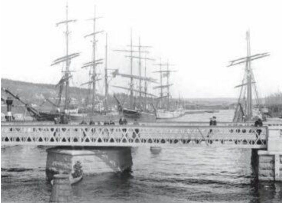
Foto från 1902. Tivolibrön i Sundsvall 1902. Tivolibrön var vid denna tid vridbar för att vissa segelskutor skulle kunna ta sig upp för Selångersån en bit.

Dessa bilder är från Sundsvalls museum, https://digitaltmuseum.se/search/?q=tivolibrön&aq=owner%3F%3A%22S-SM%22