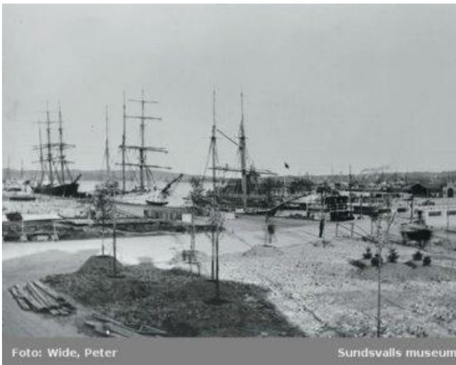
Foto från 1902. Segelskutor i Sundsvalls hamn. Tivolibron till höger