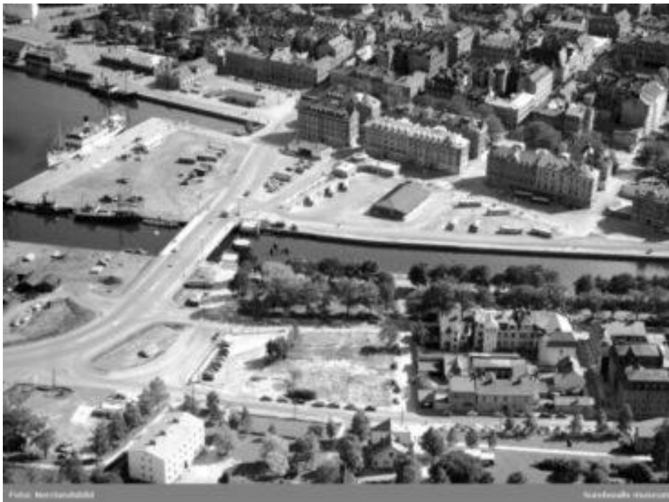
Foto från 1957-1958. Flygfoton över Folkets park, busstationen, Norrmalm, Norra kajen och Tivolibrön