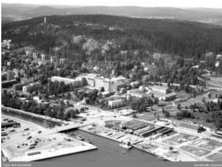
Foto från 1957-1958. Flygfoton över Folkets park, busstationen, Normalm, Norra kajen och Tivolibrön.