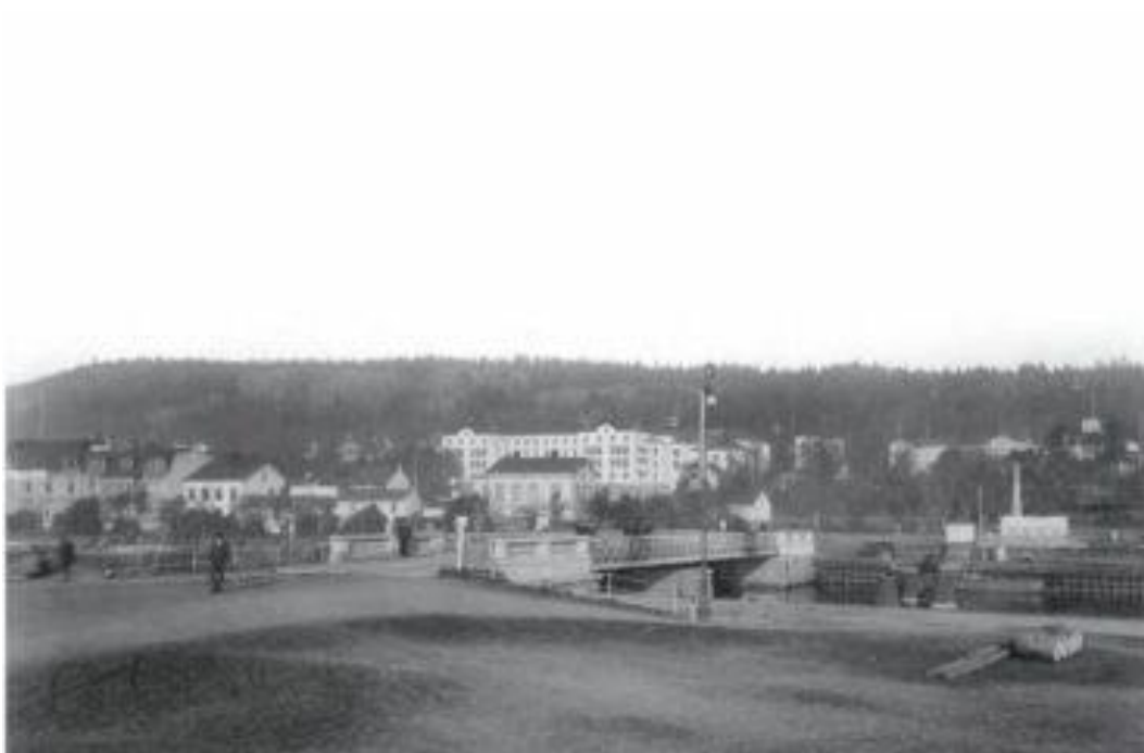
Foto från 1907. Tivolibron (svängbron) med gamla lasarettet och restaurang Tivoli på Norrmalm i bakgrunden