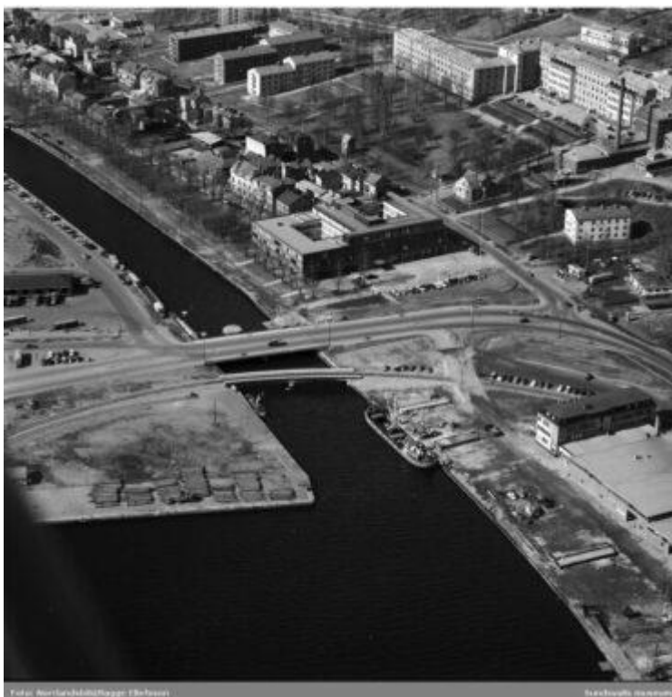
Foto från 1961. Flygfoton över Norrmalm med SCA:s nybyggda huvudkontor