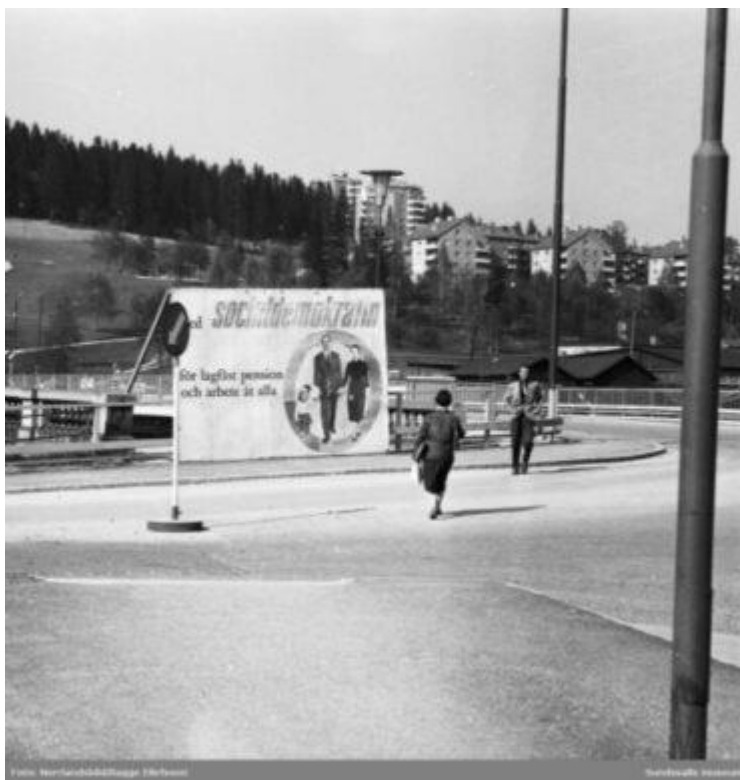
Foto från 1958. Valkampanj i Sundsvall 1958 med valaffischer söder om Tivolibrön