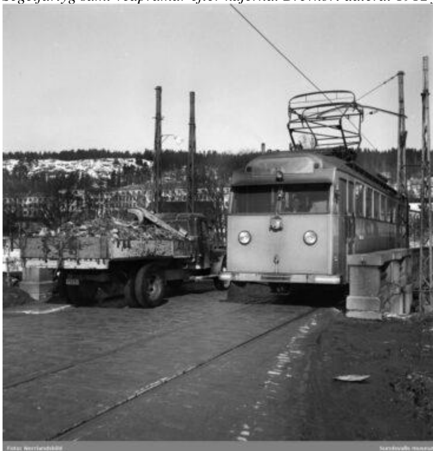
Bild från 1951. Det är trångt om saligheten då en spårvagn och en lastbil möts på den gamla Tivolibrön över Selångersån