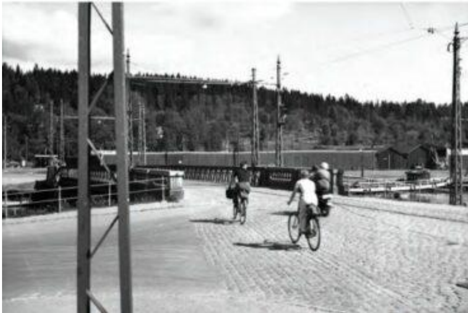
Äldre foto. Cyklister på väg över Tivolibron