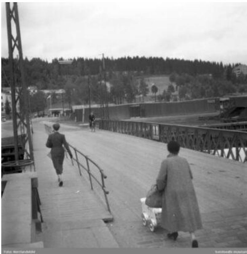
Foto från 1954. Två kvinnor, en med barnvagn, promenerar norrut över den gamla svängbara Tivolibrön.