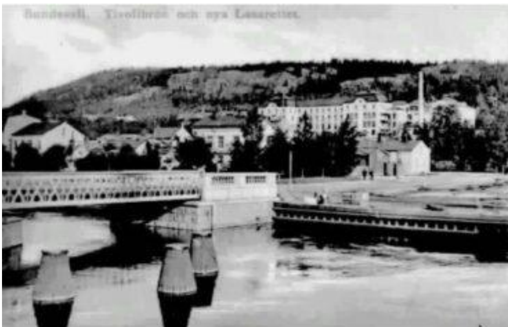
Foto från 1898 — 1908. Tivolibrön med nya lasarettet i bakgrunden