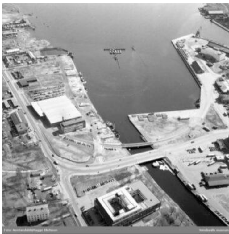
Foto från 1961. Flygfoto över Järnvägsbron, Tivolibron, Norra kajen och SCA-kontoret