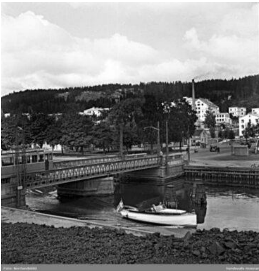
Foto från 1950-1959. Vy från Selångersåns utlopp mot den gamla svängbara Tivolibron, Normalm och lasarettet