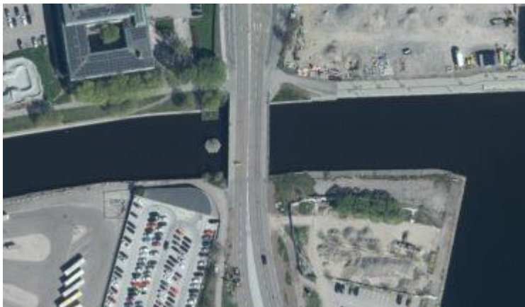
Flygfoto över Tivolibrön, år 2022