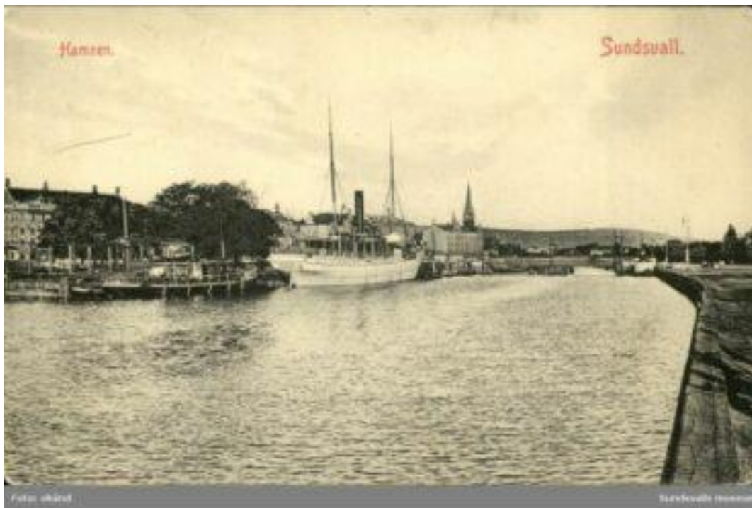
Foto från 1905-1915. Vykort med motiv över passagerarbåtarna vid Tivolibron i Sundsvall