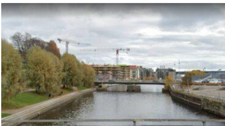
Tivolibrön sett från Puckelbron uppströms Tivolibrön